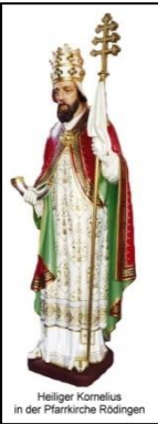
Heiliger Cornelius in der Pfarrkirche Rödingen