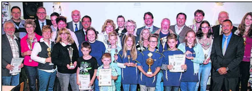
Bild der Siegerehrung 2013

Wir bedanken uns bei allen Spendern, Helfern und Teilnehmern.