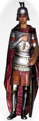
St. Cornelius Kirche Rödingen

Wir bedanken uns bei allen Spendern, Helfern und Teilnehmern.