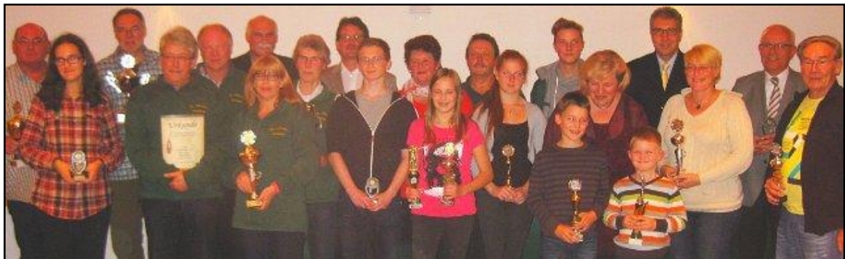
Bild der Siegerehrung 2013

Wir bedanken uns bei allen Spendern, Helfern und Teilnehmern.