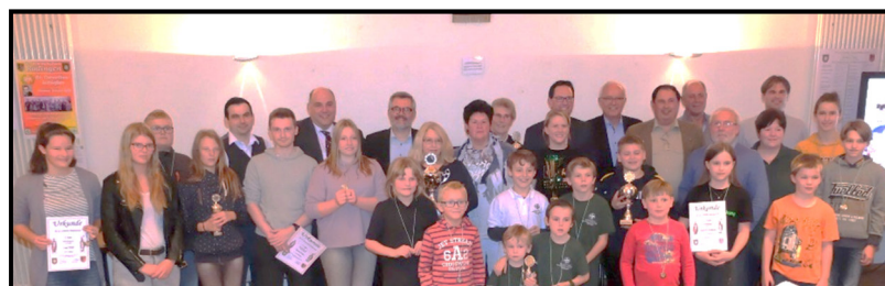
Bild der Siegerehrung 2018

Wir bedanken uns bei allen Spendern, Helfern und Teilnehmern.