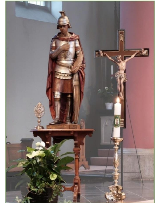
Die Statue des Hl. Sebastianus, die „Schützen“ Monstranz mit Reliquien des Hl. Sebastianus und eine brennende Vereinskerze in der Pfarrkirche St. Kornelius Rödingen..

Info@schuetzen-roedingen.de www.schuetzen-roedingen.de www.facebook.com/SchuetzenRoedingen